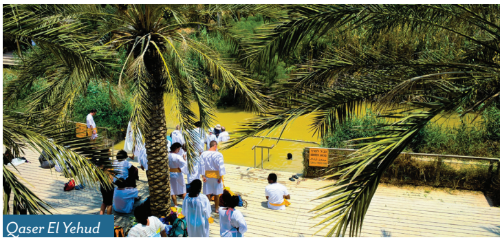
Qaser El Yehud